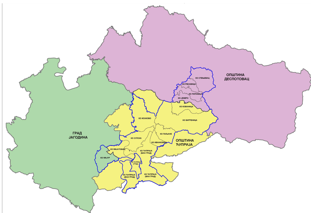
Слика бр.1 – Граница обухвата Просторног плана у односу на границе јединица локалних самоуправа и катастарских општина